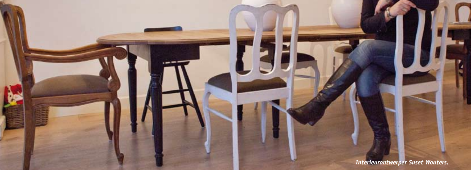
Interieurontwerper Suset Wouters.

Iedereen die verhuist of verbouwt komt voor de vraag te staan hoe het interieur eruit zou moeten zien. Hoe de juiste sfeer in huis ontstaat. Interieurontwerper Suset Wouters heeft een aantal handige tips. Daaruit blijkt dat er ook met weinig middelen veel te bereiken is.