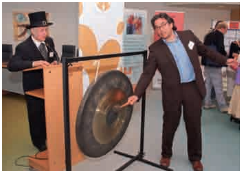
De beursvloer werd geopend door op de gong te slaan.

Naast manege Balans heeft de SPGSD een vakantiewoning te huur: Het Groote Huis.